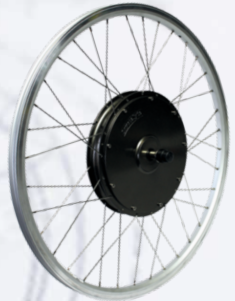
HS 2440 - bespaakt