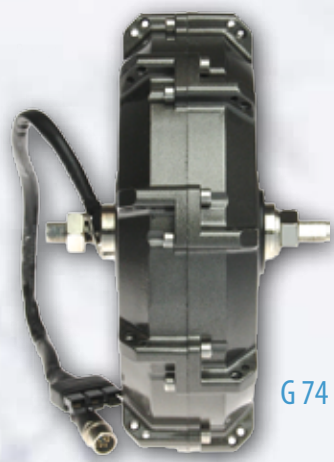
G 74 FRONT